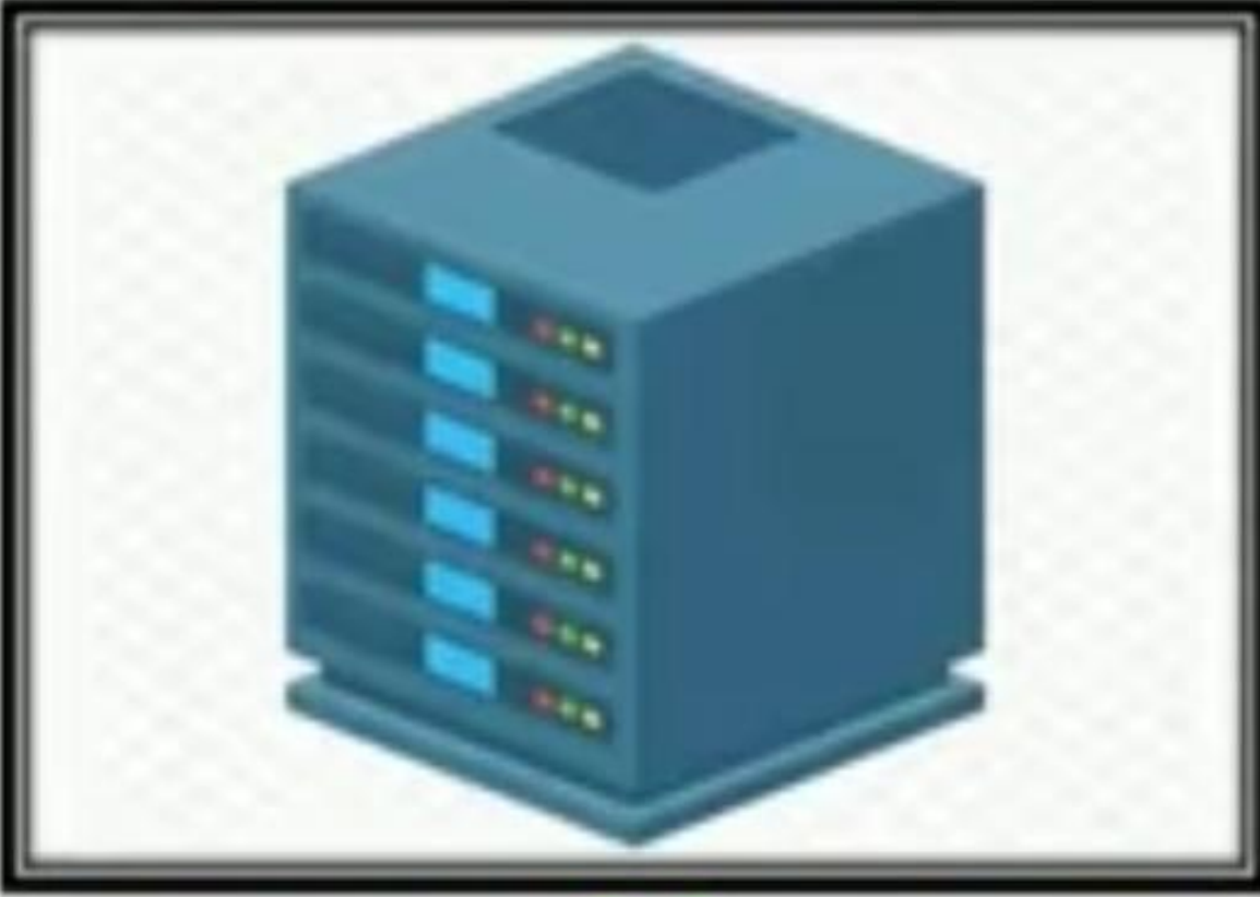
வைக விரிவு வலை